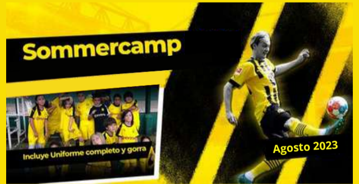
CURSO DE VERANO (2024)