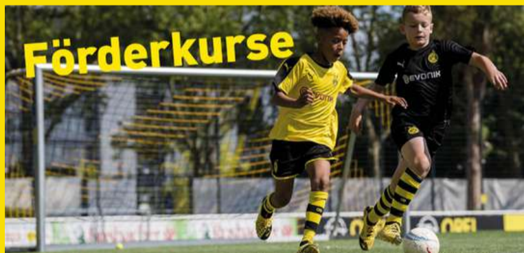
VIAJE A DORTMUND ( 2024)